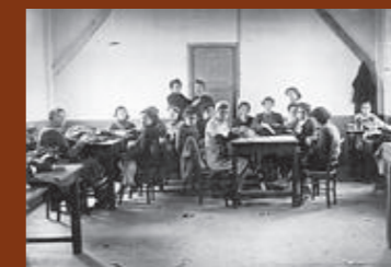
Atelier de tailleurs et couture du camp de Rivesaltes. F/7/15105.