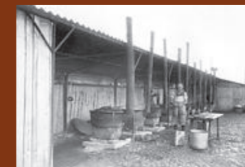
Cuisine du camp de Gurs. F/7/15104.