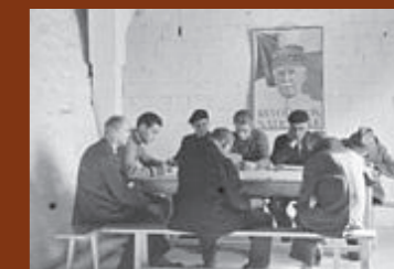
Cours au camp des Milles. F/7/15095.