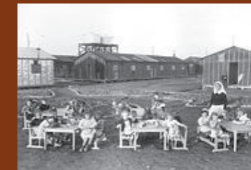
Cour du jardin d'enfants du camp de Gurs. F/7/15104.

16h30 Discussion 17h00- 17h15 Conclusion : retour sur les enjeux des humanités numériques, par Serge WOLIKOW, président du conseil scientifique de la Fondation pour la Mémoire de la Déportation et directeur scientifique du Consortium Archives des mondes contemporains