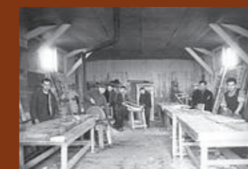
Atelier de menuiserie du camp de Pithiviers. F/7/15101.