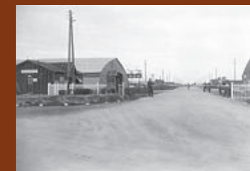
Entrée principale du camp de Gurs. F/7/15104.