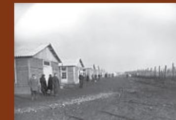
Vue sud du camp de Pithiviers. F/7/15101.